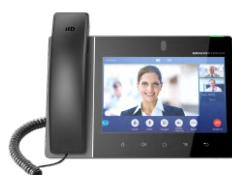
Telefon IP Wideotelefon IP