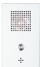
Stacja interkomowa IP