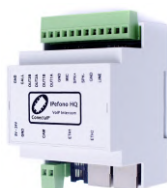
Moduł interkomowy IP